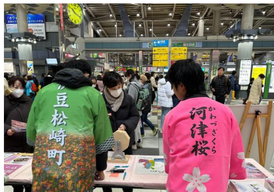
松崎町・河津町との広域連携 「桜広域連携事業」の推進