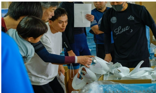
オープンファクトリー-CRASSOの様子

現在はものづくり企業だけでなく、サービス業も含めた様々な事業者が参画し、ものづくりを観光化するファクトリーツーリズムとして、自治体や金融機関などとも連携し、開催エリアも3市3町(高松市、さぬき市、東かがわ市、三木町、小豆島町、土庄町)まで拡大しています。この取り組みが評価され2024年に東かがわ市より第1回東かがわ市未来アワードを受賞しました。