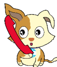
行政相談のマスコット キクーン

I P 電話などをご利用の場合は、電話番号 03-3363-1100 におかけください。