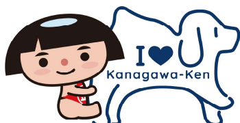
神奈川県 PR キャラクター かながわキンタロウ