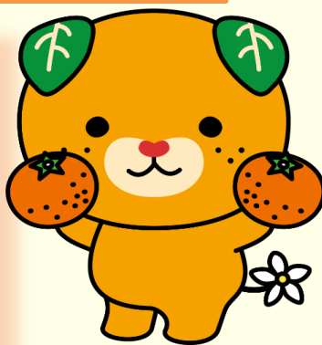
愛媛県イメージアップキャラクター みきやん

品目数でも、愛媛県は40品目（温州みかん1と中晩柑類39）もあり、 全国1位 。 愛媛県が独自に行っている統計調査によれば、名称が確認されたものだけで かんきつ類の収穫品目数は45品目となっています。