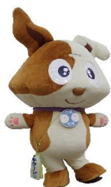
<行政相談マスコット：キクーン>

ボクも一緒に イベントを盛り上げます！ 11/17(月)は、キクーンも 会場にかけつけます！