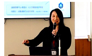
高山氏（ファシリテーター）