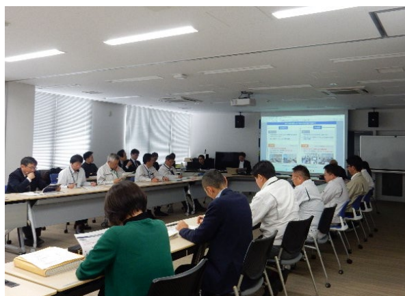
会議での報告の様子