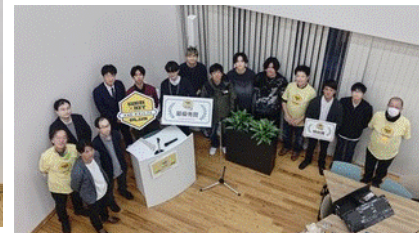
＜参加者の集合写真＞

四国総合通信局は、今後もIoT人材育成を支援してまいります。 お問合せ先：情報通信部 情報通信振興課 089-936-5061