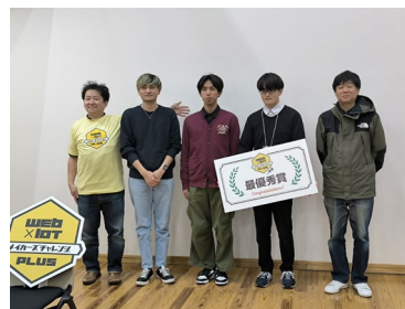
＜最優秀受賞チームの集合写真＞