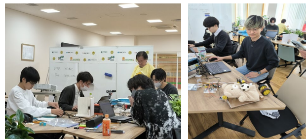
＜ハッカソンチーム作業の様子＞

スマホを充電台に置くとアラーム等が発動。設定時刻を過ぎても睡眠中と判定された場合、布団の剥ぎ取り、ハンマー打撃、ベッドの強制傾斜が順次発動する「入眠・起床管理システム」。