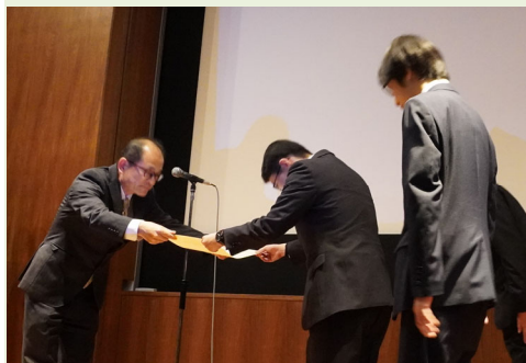
<四国総合通信局長表彰>