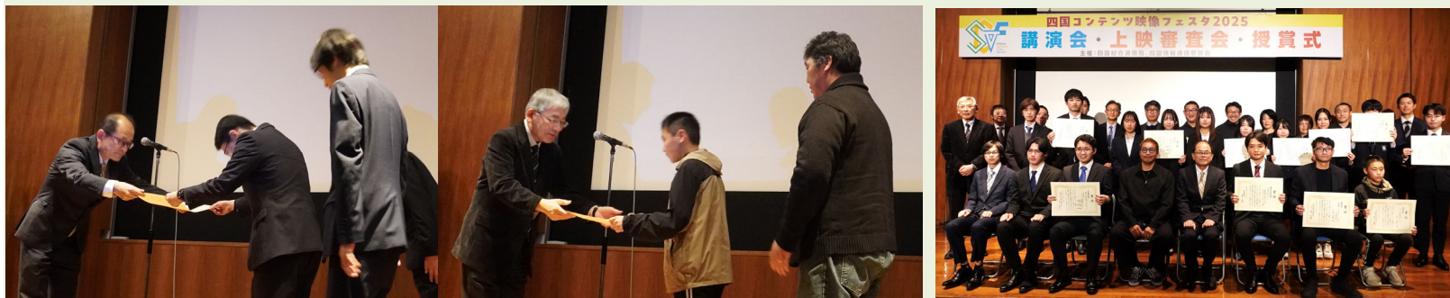
<講師・受賞者・審査員等集合写真>

受賞者からは、「今後も地域の物語を見てくださいる皆さまの心に残るような映像を制作していきたい」という思いのこもったコメントをいただきました。