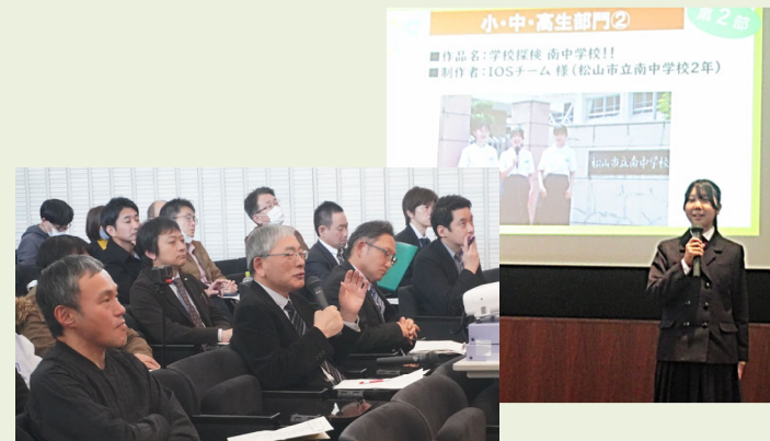
<作品紹介／審査員講評の模様>