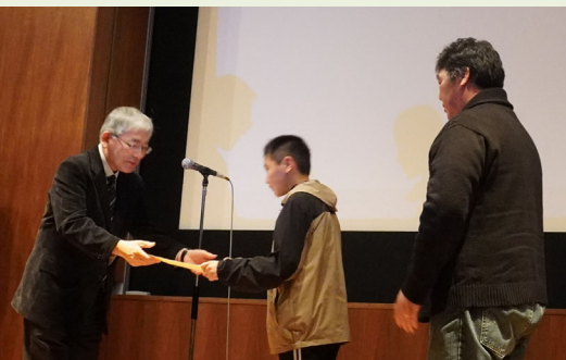
<四国情報通信懇談会長表彰>