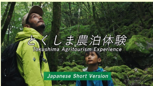
<プロ・セミプロ・自治体部門：とくしま農泊体験>