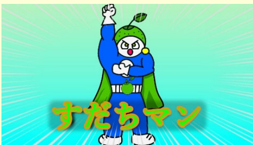
<アマチュア部門：愛と自由の戦士 すだちマン>