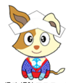
行政相談マスコット 「茶摘キクーン」

総務省静岡行政監視行政相談センター 行政監視行政相談課 村辻、縣 電話：054-254-6451