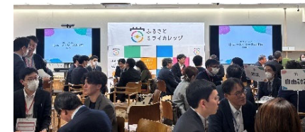
令和7年度開催 マッチングイベントの様様 (東京 大手町で開催)