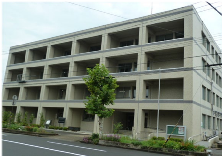
(福井地方合同庁舎)