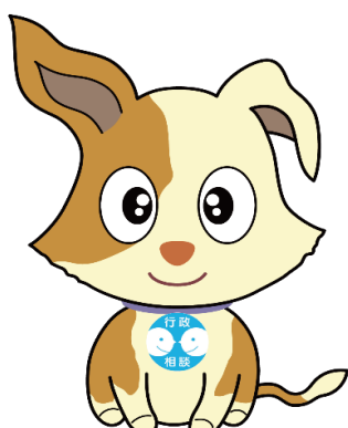
(行政相談のマスコット「キクーン」)