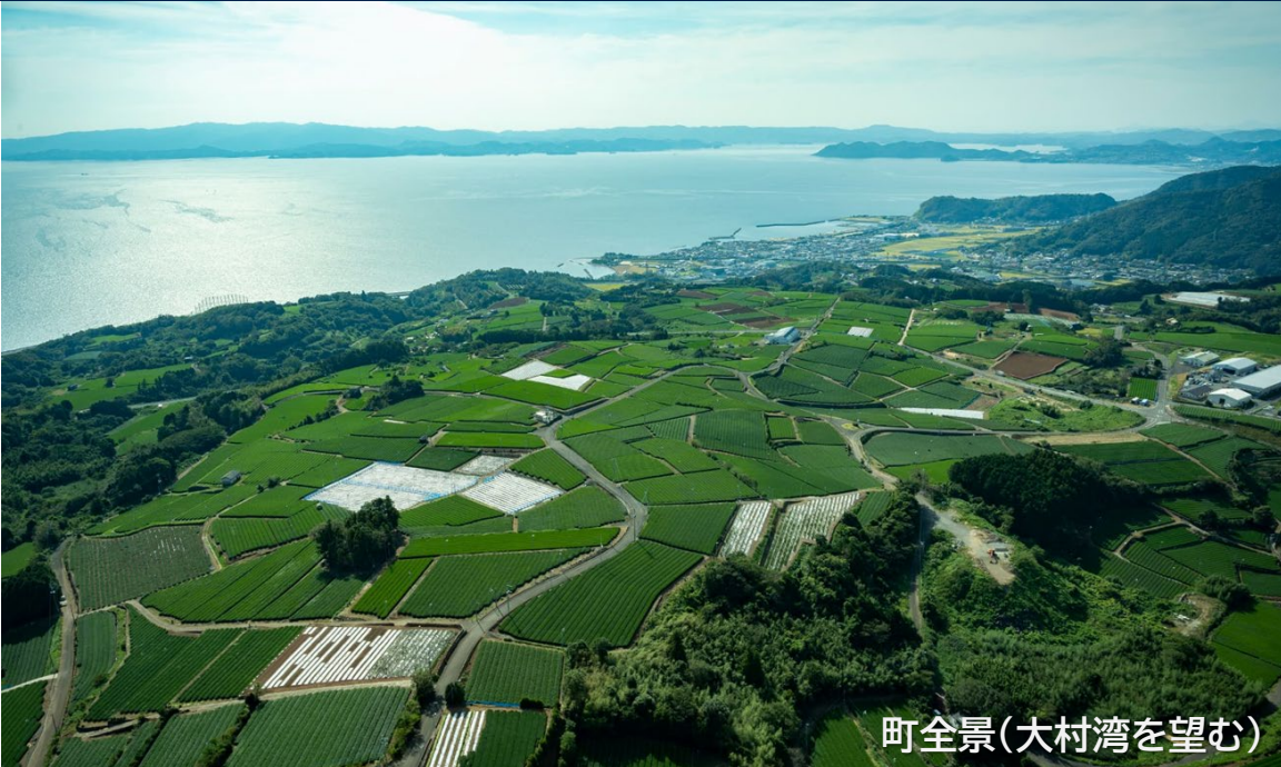
町全景(大村湾を望む)