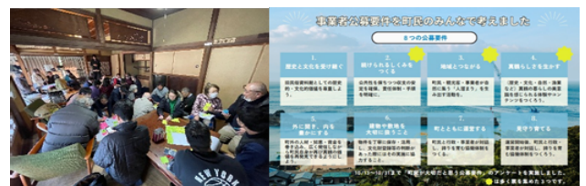
真鶴町での支援の様子