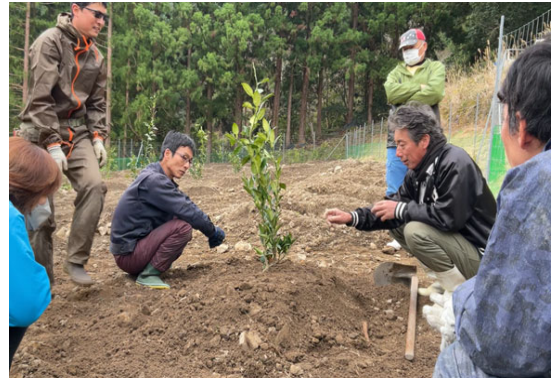
ゆずの新植指導を受ける農業研修生