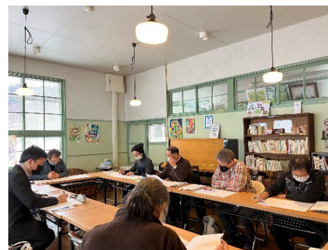
計画策定のためのミーティング