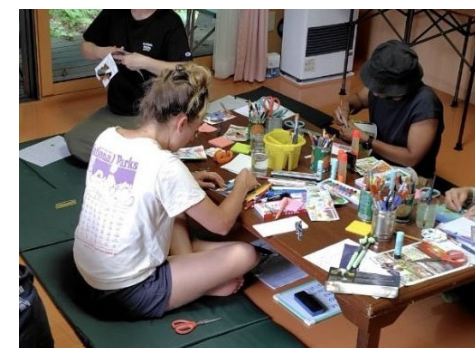
ポストカード教室