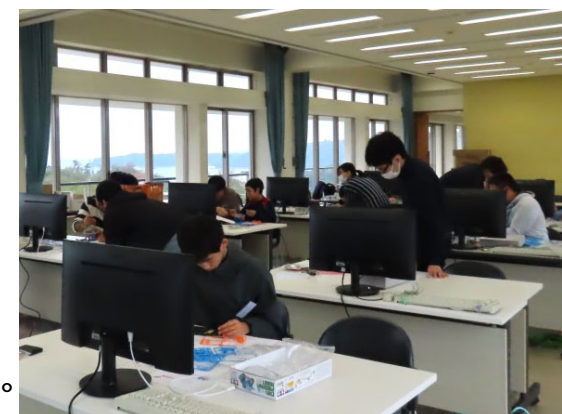
ものづくりIoT体験教室

→ほかにも、庁内外問わず、デジタル化や事業実施の計画進行などの相談に対し助言を行った。