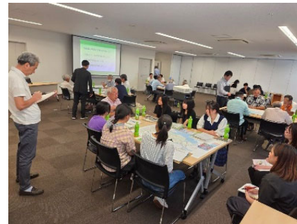
市民ワークショップ