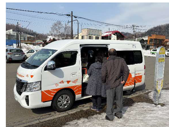
R6.10運行開始のコミュニティタクシー