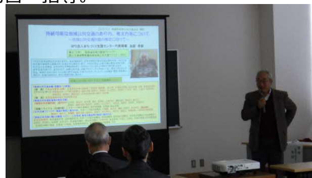
（地域公共交通についての講演）