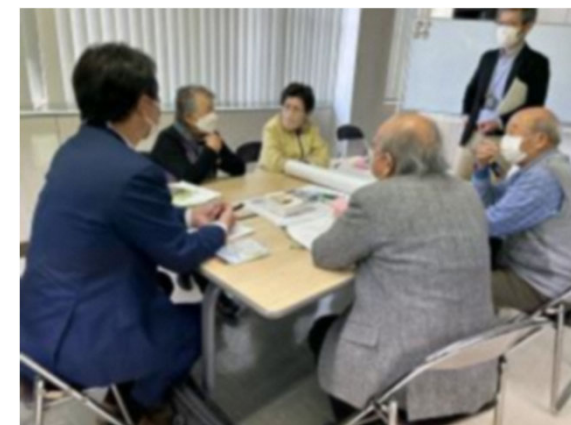
栃木市地域公共交通会議勉強会