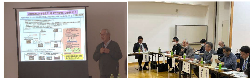
地域公共交通活性化協議会の様子