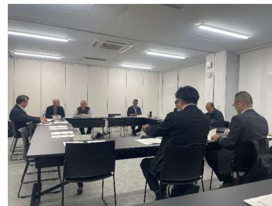
（法定協議会の様子）

令和8年度以降は、奥尻町地域公共交通計画を軸に、利便増進実施計画の事業を実施し、その評価等を行い、PDCAサイクルで奥尻町の公共交通の利便性向上を図っていく。