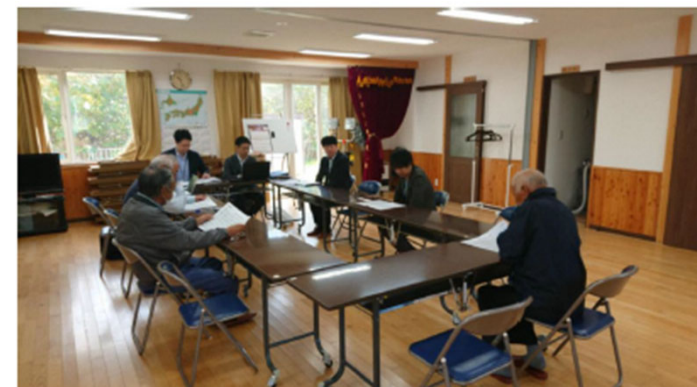
（R6.10 町民意見交換会の様子）