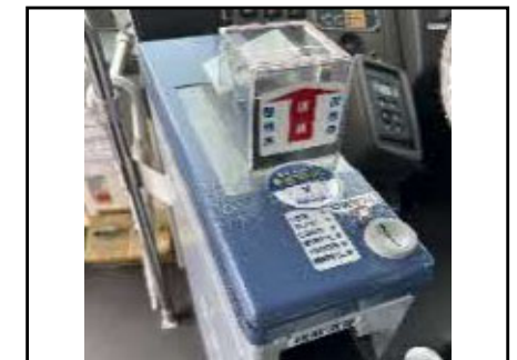
路線バスの町内移動無料化