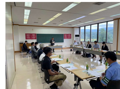
（蘭越町地域公共交通会議）