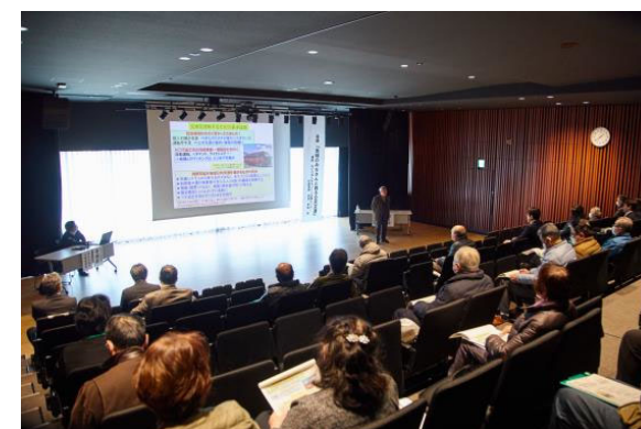
講演会 「地域のみなさんと創る公共交通」