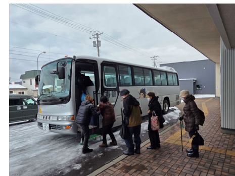
（町内を循環する「風太号」）