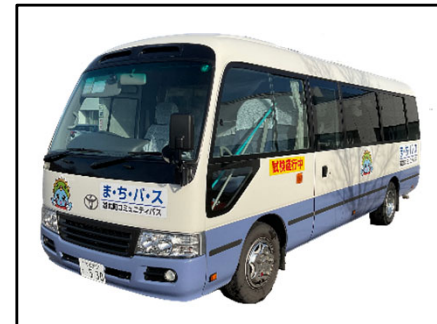
コミュニティバスの運行