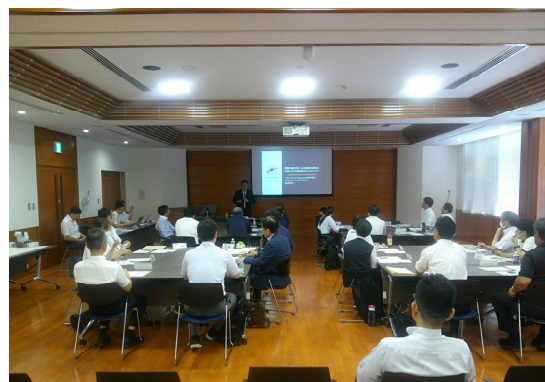
高校魅力化の講演