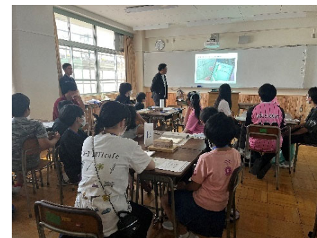
小中学生向けワークショップ