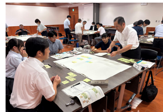
ビジョン策定ワークショップの実施