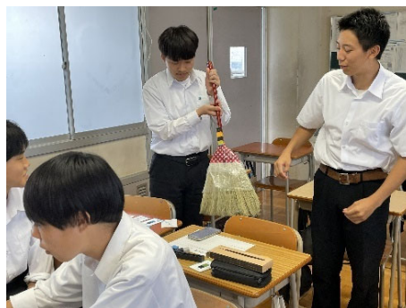
高校生向けIoTデバイス講座