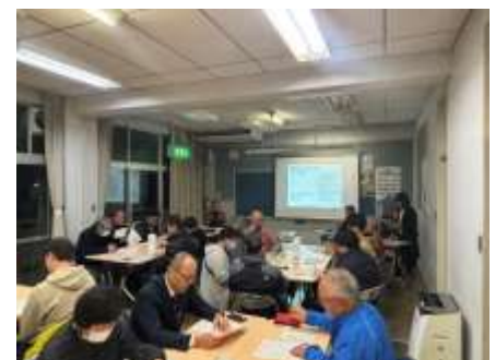
(地区別報告会の様子)