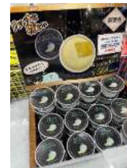
アールスメロンの ジェラート（友部SA）