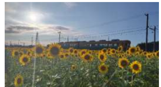
サンフラワープロジェクト実施圃場 83