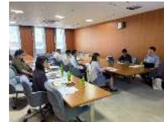
ふるさと納税寄付額 アップに向けた意見交換会