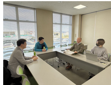
白菜日本一のブランド化 検討会議