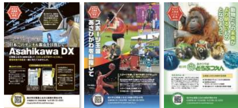
企業版ふるさと納税活用事業の紹介パンフレット