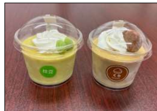
商品化された枝豆・栗のプリン