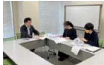
白菜日本一のブランド化 検討会議