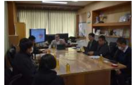
加工品開発に向けた打ち合わせ