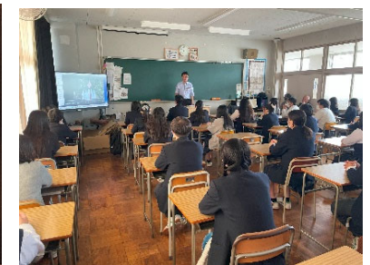
八千代高校での映像講義