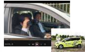
八菜まわーる号紹介動画 の撮影映像素材