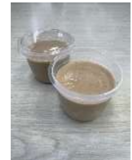
焼き芋プリン （試作）