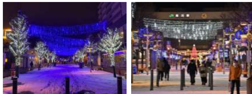
あさひかわ街あかりイルミネーション（寄附を活用した事業例）