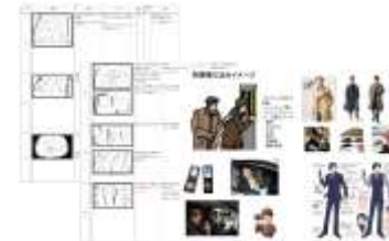
八菜まわーる号紹介動画 の絵コンテと衣装指示書