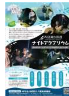
新しいアクティビティ体験