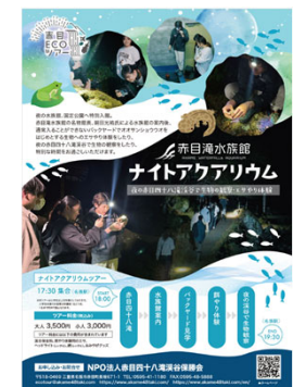
新しいアクティビティ体験