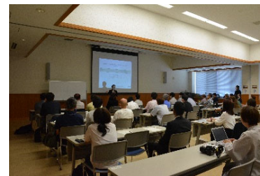
集客アップ戦略セミナー