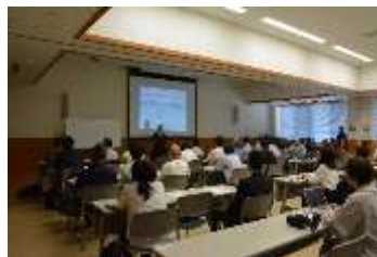
集客アップ戦略セミナー