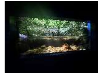
オオサンショウウオの展示