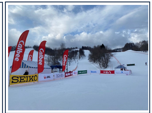
（スキー場イベント）