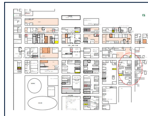
（空き店舗の可視化）