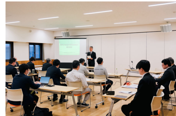
信州しなのまち複業協同組合創立総会 28