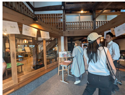
先進地視察（島根県海士町）