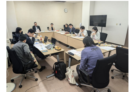
町内事業者ヒアリング・設立検討会