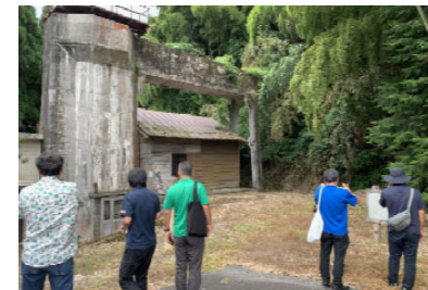
自治体・大学共同の意見交換会 （どくだみ農家訪問、発電所視察）