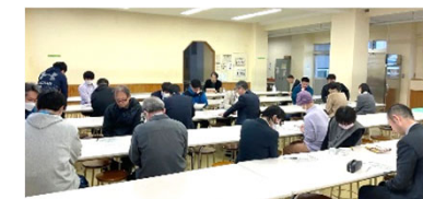
中等校の今後を考える会