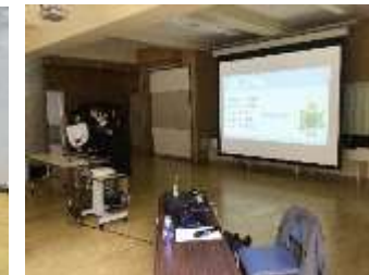
中学校と中等校との 交流の企画・運営