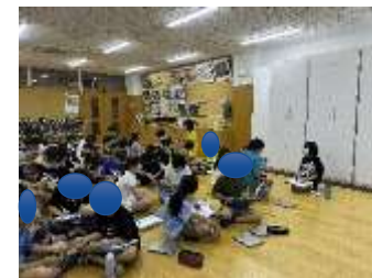
インタビュー法の 授業実施