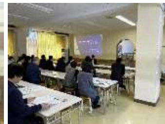
総合探究研修の講師