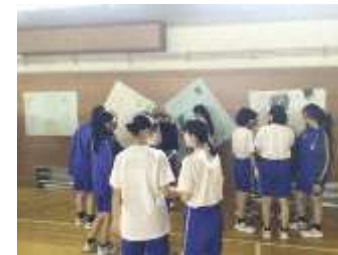
街歩き授業の企画