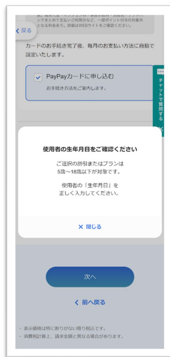
使用者年齢によって 申込不可を表すモーダル