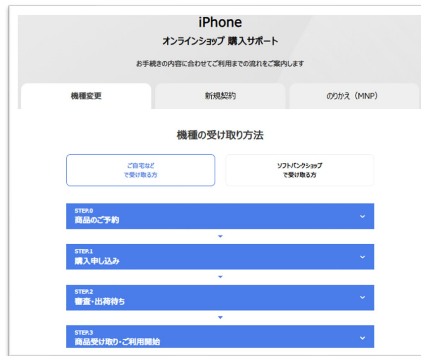
今後の端末受取方法・開通までの流れを案内