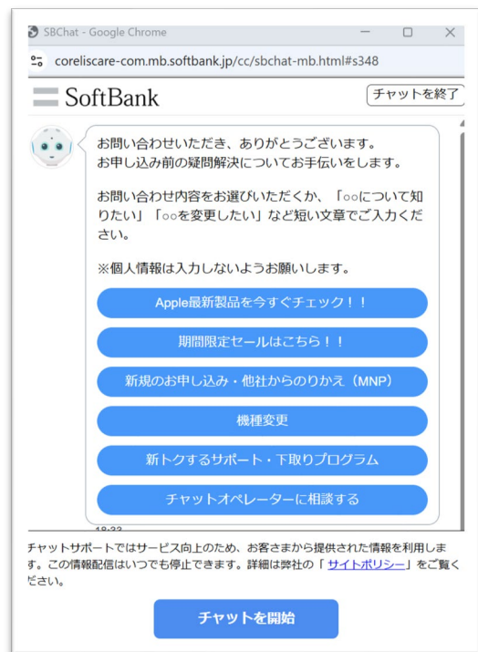
チャットボットを活用した 問合せ対応