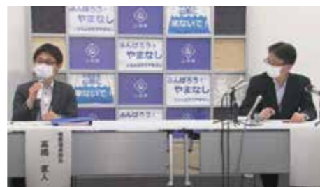
新型コロナウイルス発生時の記者会見、生中継で緊張が走る

今から10年、20年先、人口減少が進むこの国に何が待ち受けているか。地方とともに未知の課題に向き合ってみませんか。