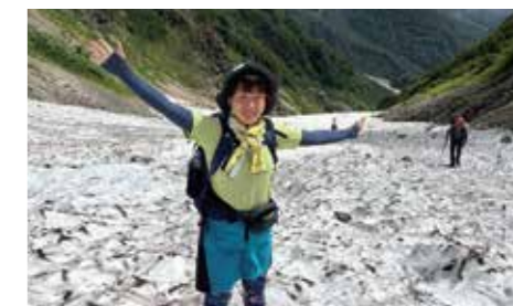
休日は自然を満喫！一昨年から登山に挑戦