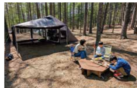
キャンプやスノースポーツなど群馬らしい週末を楽しんでいます

私にとって群馬定住のきっかけとなった地方自治体勤務をはじめ、技術系職員も多様な経験ができることも総務省の魅力です。新しい知識・技術・環境に出会えることを「楽しい」と思える人には活躍できる場があふれています。ぜひ一度、業務説明会やインターンにきてみませんか。