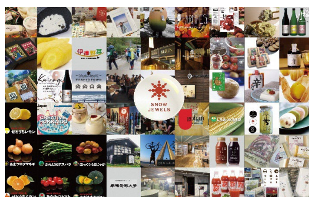
シン地域食のプラットフォーム SNOWJEWELS