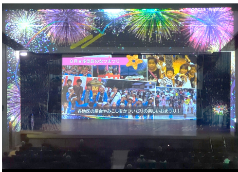
多気町20周年式典プロジェクトマッピング (地元中学生が中心になって制作)