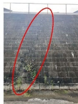
上下に連続する擁壁のひび割れ