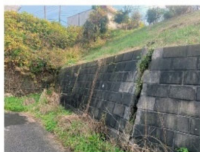
のり面のハラミ 擁壁のズレ