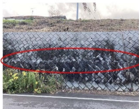
水平方向に連続する擁壁のひび割れ