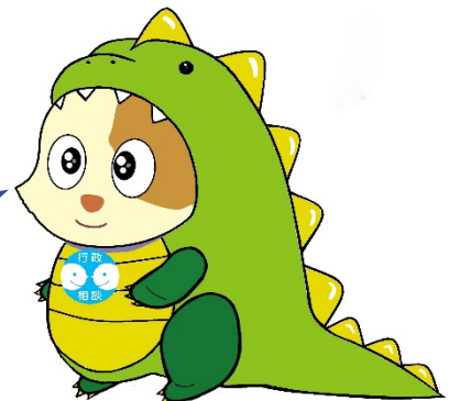
行政相談のマスコット 福井キクーン（フクーン）