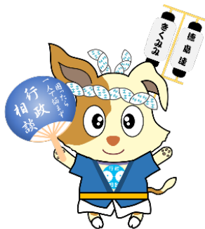
行政相談マスコット キターン

(担当) 行政監視行政相談課 片桐、西村 電話：088-654-1531 Mail：tokus30@soumu.go.jp