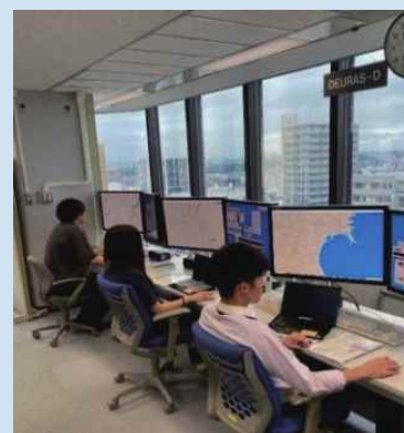
監視室にて電波監視

配属された部署の特性上、出張は多いですが、運転が好きな方や外回りが好きな方は向いていると思います。また、出張先の街の雰囲気やご当地の美味しい物を味わうことができることが付随した魅力の一つでもあります。上司は優しく・面白い方が多く、フランクな雰囲気の職場です。気になった方はぜひ説明会へ！