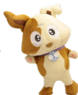
行政相談マスコット 「キクーン」