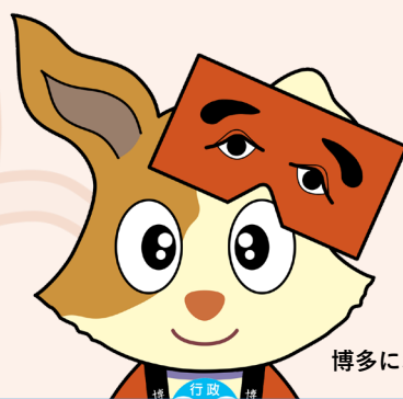
博多にわかキーン