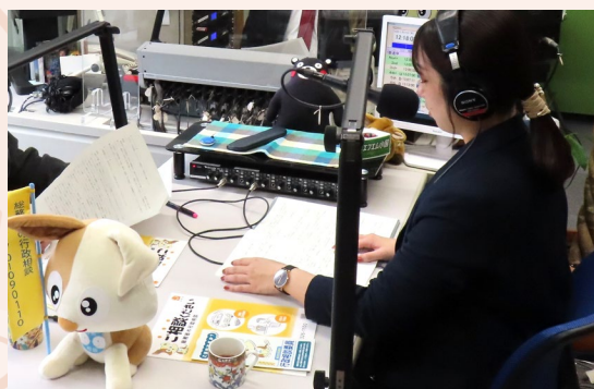
ラジオに出演し、相談業務をPRしている様子

当局では、日々の業務内容が多岐にわたり、その変化を大変だと感じることもありますが、毎日新鮮な気持ちで業務に当たることができ、公務員のイメージを良い意味で裏切ってくれます！ぜひ説明会でお待ちしています。