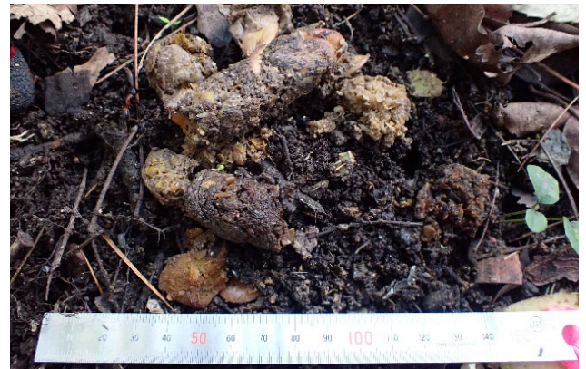
糞 (食べたものが混じることがある)