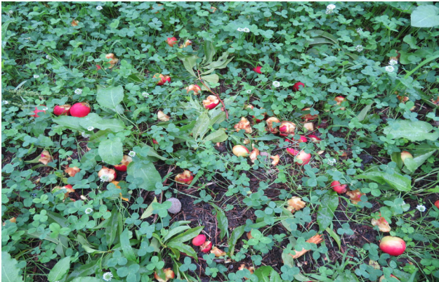
落ちた果実 (柿・栗・桃等の果実)