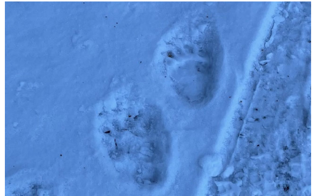
足跡 (人の手と同じくらいのサイズ)