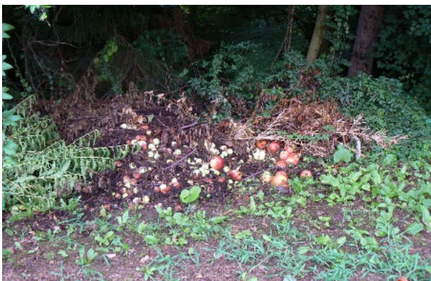
生ごみ・廃果 (地域・集落内でのごみの投棄)