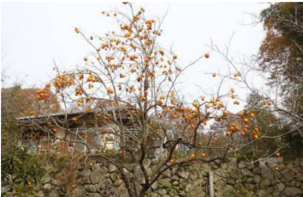
実が残っている木 (収穫されず実が残る木)