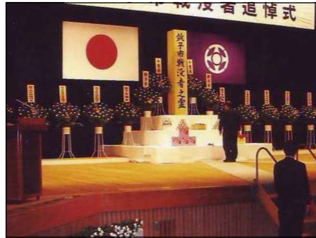
※写真提供 銚子市 (写真は平成21年度のもの)