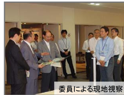
委員による現地視察