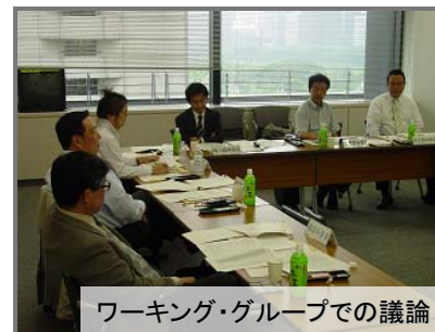
ワーキング・グループでの議論