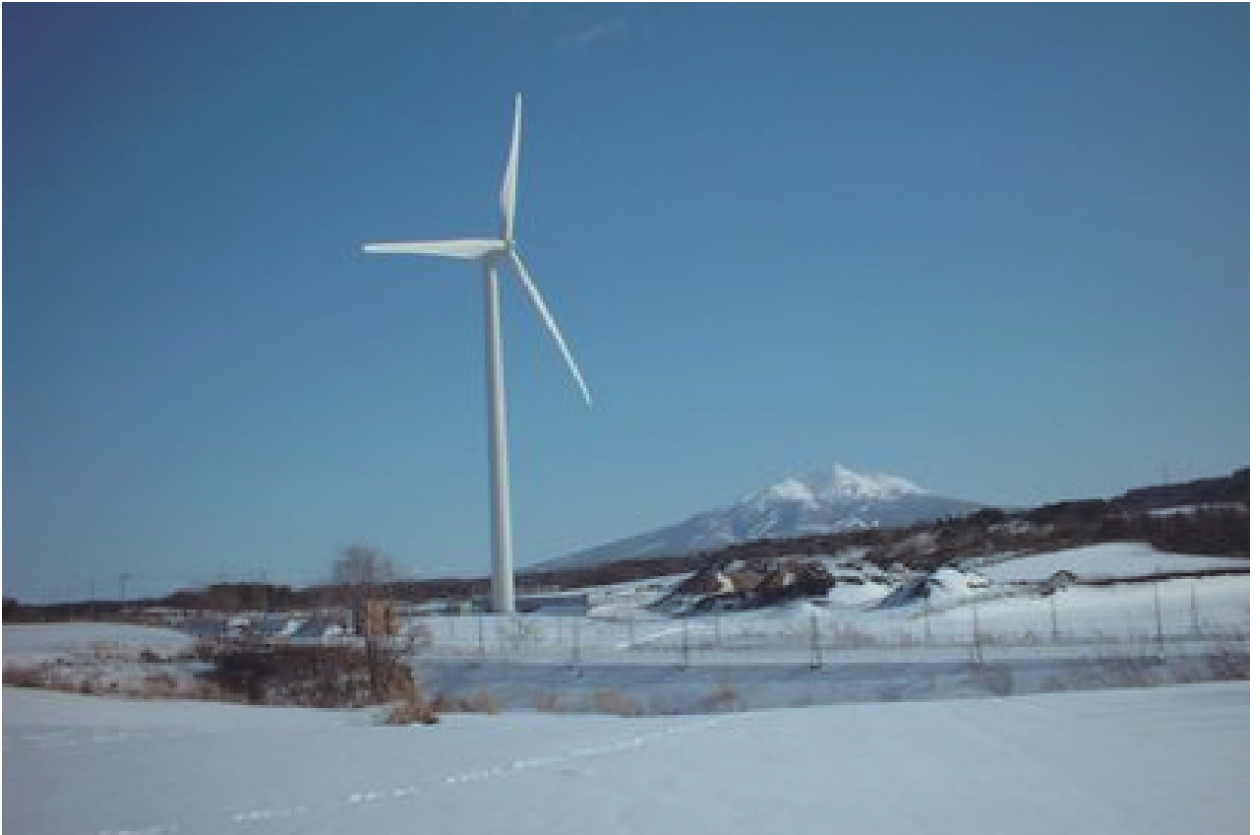
平成15年2月に建設された、市民風車わんず。 この風車建設をきっかけに我々GEAの鱒ヶ沢町を舞台とした地域活性化事業が始まった。