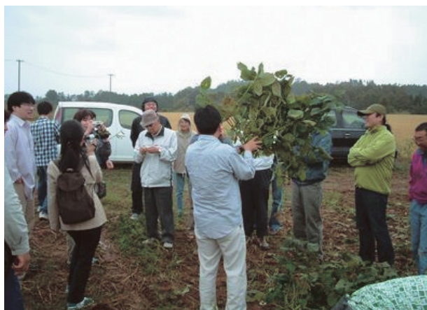
都市と農村の交流を図り、消費者参加型の新たな農業の可能性を探るため、「白神エコツーリズムとわんずの集い」を開催。写真は市民風車ブランドの毛豆「風丸」の収穫体験のひとつ。

「厄介もの」だった風が「地域の資源」、「自然の恩恵」と捉えられるようになり、市民風車事業を通じて地域の課題を解決し、市民風車に関わる者「みんなが幸せになる」こと、「地域に信頼を創る」ことを目指す一連の取組みは、市民参加型・パートナーシップ型をキーワードとした「新しい社会的価値を生み出す先進モデル」と位置づけられるものとして評価された。