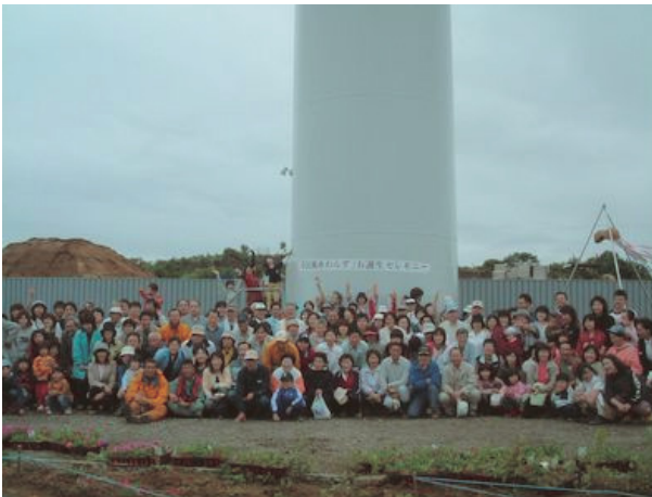
平成15年7月20日、県内出資者（鱒ヶ沢町枠・青森県枠）488名の風車への記名のお披露目も兼ねて、「わんず」お誕生セレモニーを開催した。