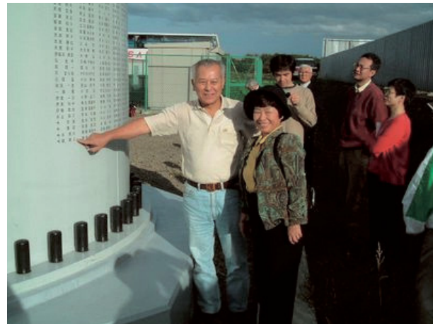
自分の名前が刻まれた市民風車支柱の前で記念撮影する出資者。（お誕生セレモニーにて）