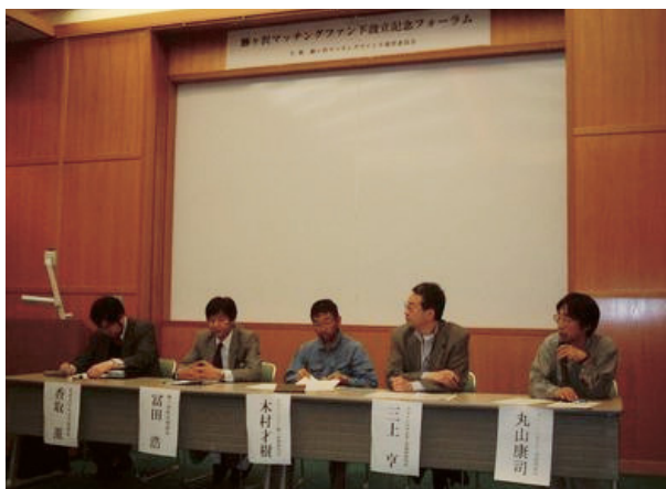
平成17年5月19日に開催された鱈ヶ沢マッチングファンド設立記念フォーラム。