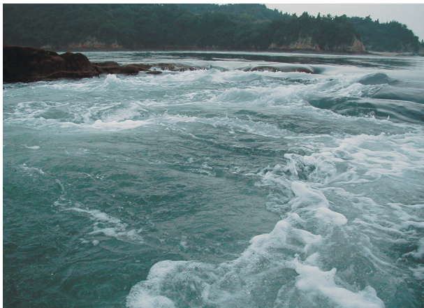
激しい潮流が渦巻く様は脅威そのもの!

海賊の歴史を活用しながら、潮流そのものが醸し出す魅力を通じ、綺麗な海がいかにか素晴らしいものであるかを人々に知らせる機会となり、海にこだわった活動が綺麗な瀬戸内の海を守る機運の高まりに貢献している点が評価された。