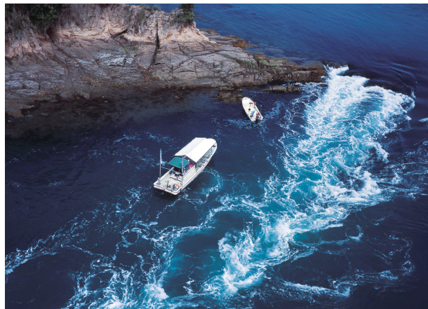
潮の流れで浄化される綺麗な海が訪れる人に安らぎを与えている。