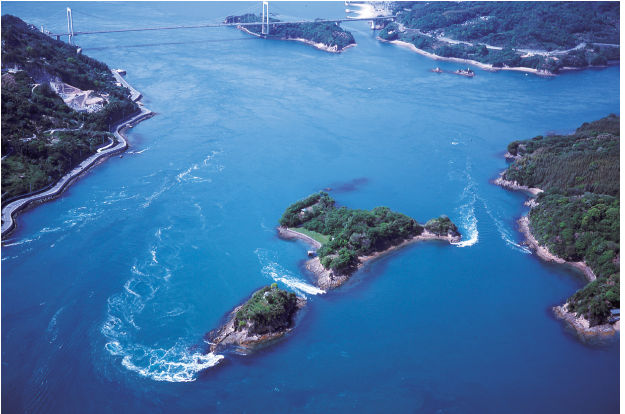
能島全景。かつては瀬戸内海を支配した能島村上水軍の本拠であった。