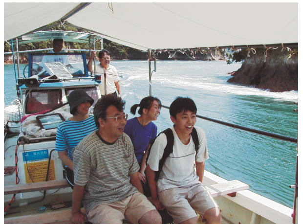
乗船風景。海面が沸き立つような潮の流れを感動的に体験できる。