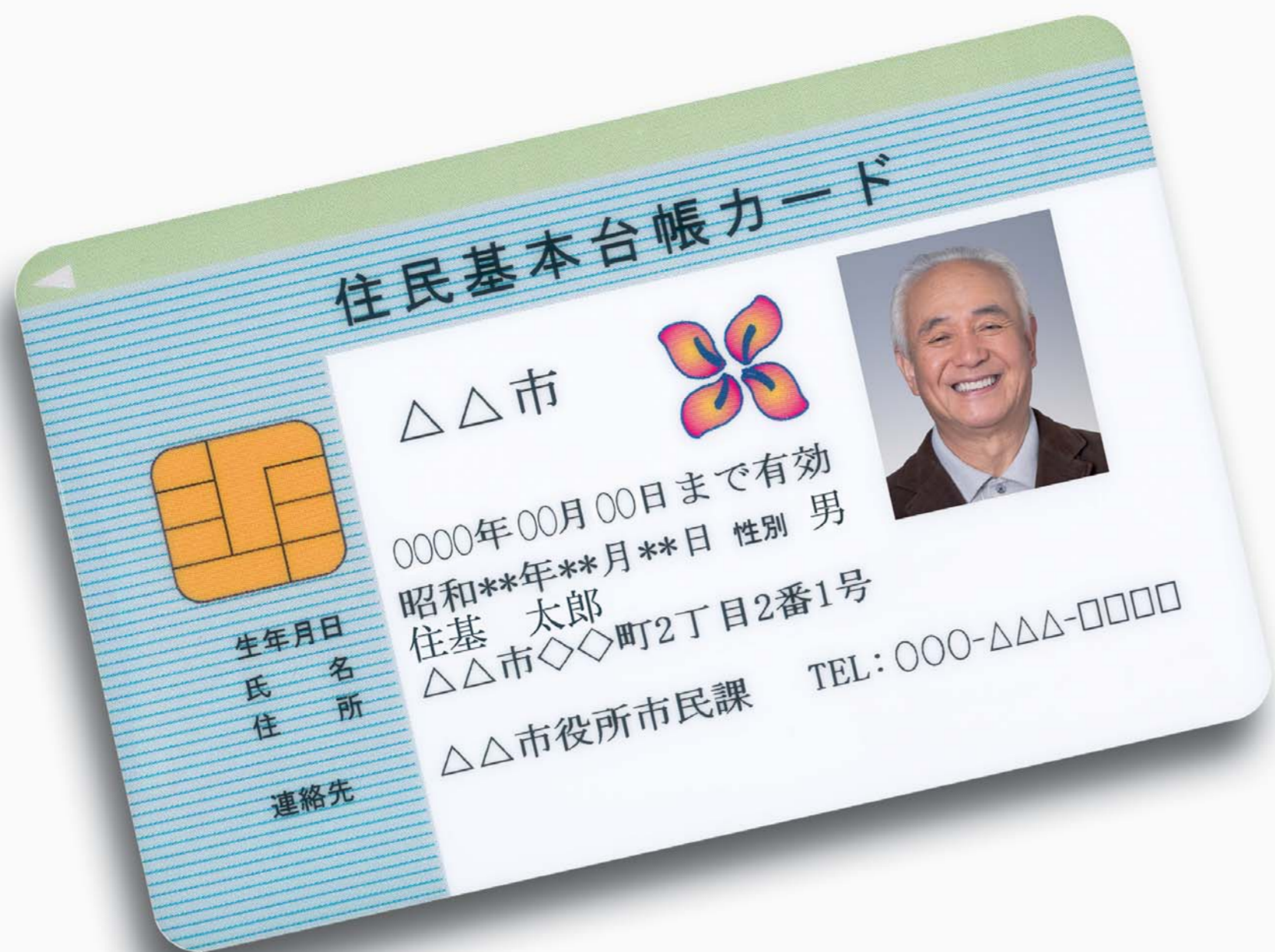
「写真付き住基カード」