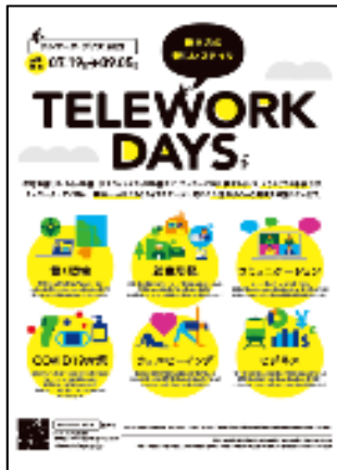
ملصق أيام العمل عن بعد 2021

نائب المدير العام لمكتب الإعلام والاتصالات، وزارة الشؤون الداخلية والاتصالات