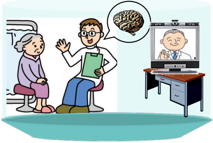
【内科遠隔医療支援】