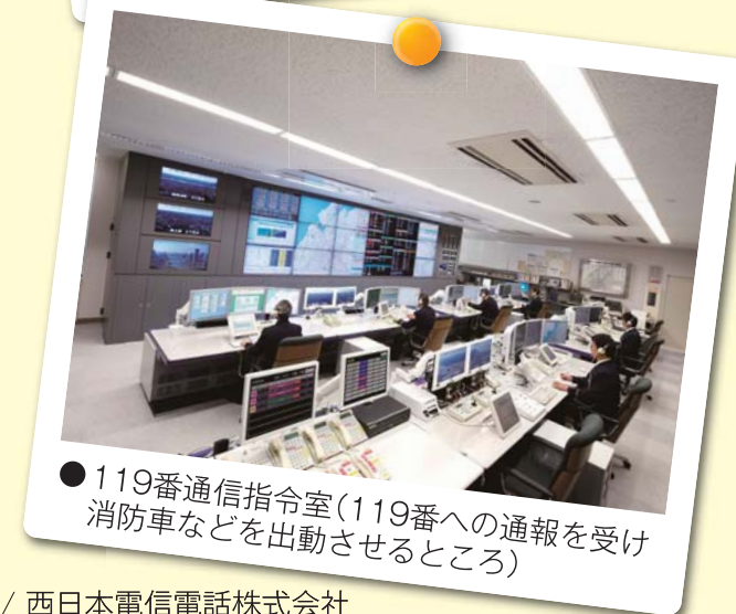
●119番通信指令室(119番への通報を受け消防車などを出動させるところ)