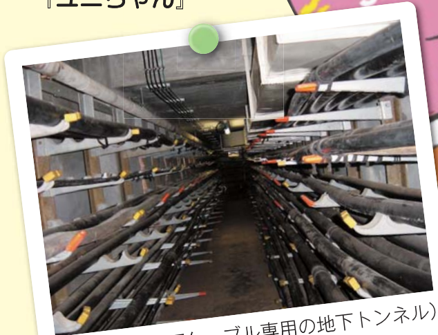
●とう道(NTTケーブル専用の地下トンネル)