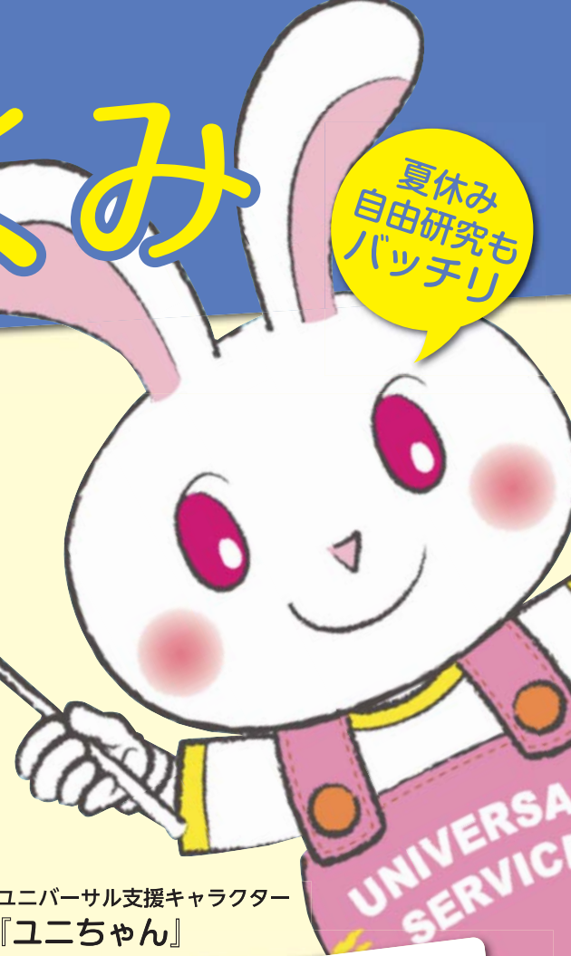
ユニバーサル支援キャラクター 『ユニちゃん』