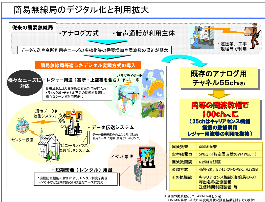
図1-2 簡易無線のデジタル化と利用拡大

今回の制定によって、簡易無線はデジタル化され、それに従ってその利活用分野が拡大される事例を図1-2に示す。