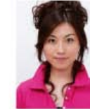
上部余白がないもの