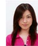
前髪が目元にかかっているもの