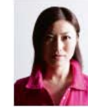
顔に影があるもの