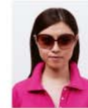
サングラスをかけているもの