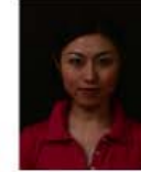
背景の色が濃く人物を特定できないもの