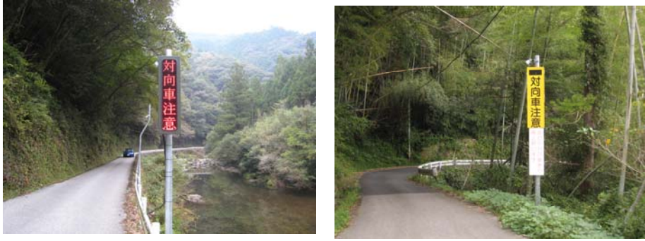
県道33号線(高知県高知市土佐山梶谷) 県道269号線(高知県南国市白木谷)